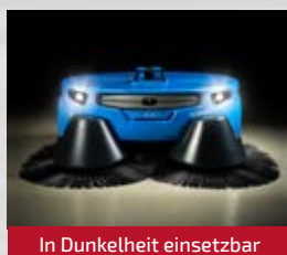
In Dunkelheit einsetzbar