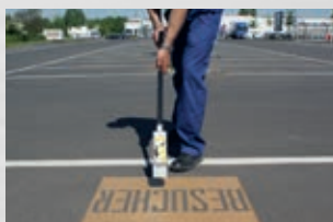
Schneller Umbau zum Markierstock