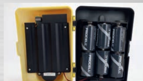
Eigene batteriebetriebene Stromversorgung