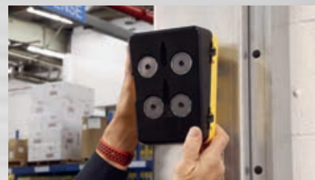
Anbringung per Magnet oder per Schraubaufhängung