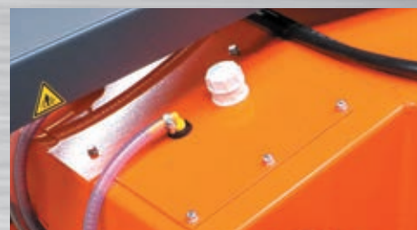
Optional mit integriertem Wassertank