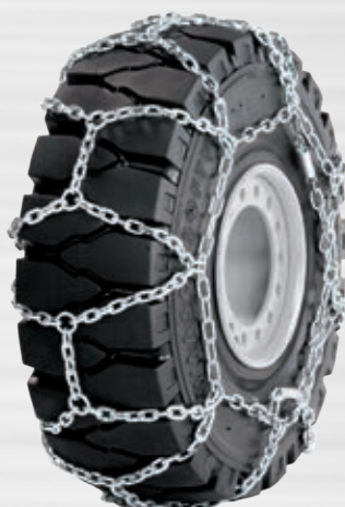
Art.-Nr. 79790314 (Spurkreuzkette, Typ B)