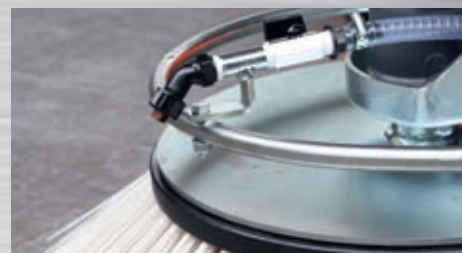
Seitenkehrbesen mit Wassersprüheinrichtung